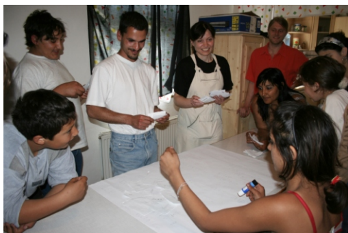
Účastníci programu na téma Lidská práva se zamýšleli mimo jiné nad tím, co je pro ně v životě nejvíc důležité.

Český západ o.s. Dobrá Voda 8 364 01 Toužim tel.: 353 391 132 mobil: 602 663 585 info@cesky-zapad.cz www.cesky-zapad.cz